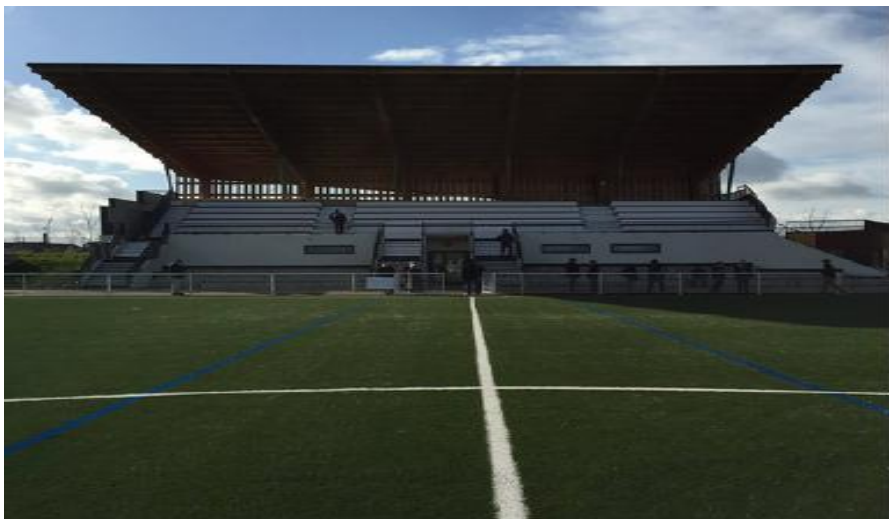
Le Parc des Sports JUST FONTAINE à St Pierre du Perray