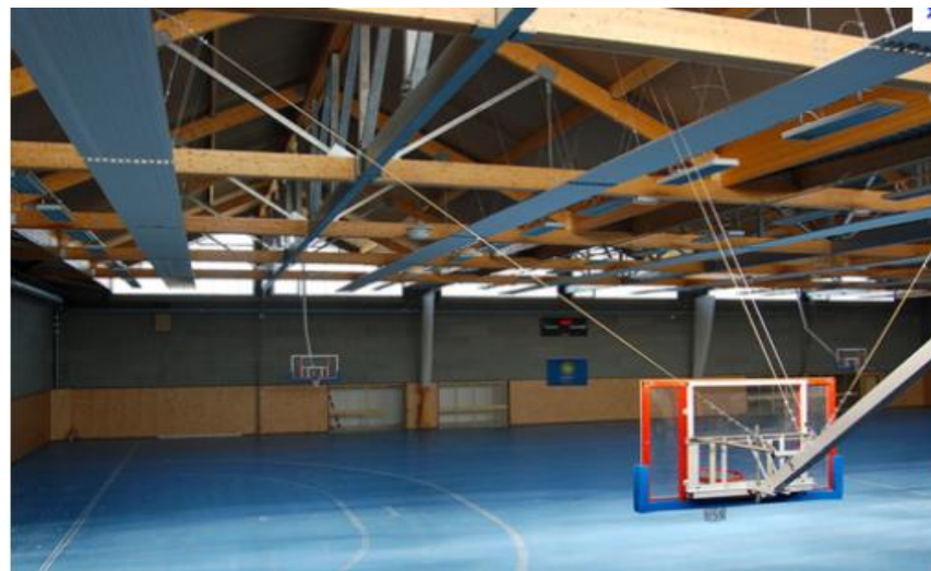
La halle sportive de Tigery