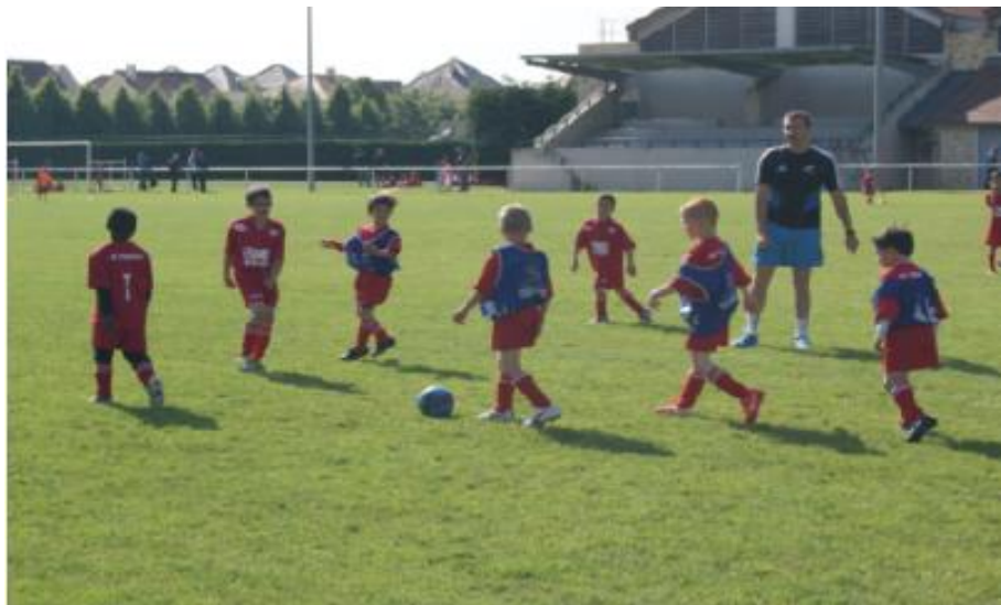
Le stade GEORGE MAILLARD de Tigery