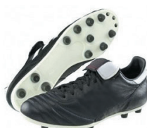
Crampons « moulés » Terrain sec ou dur

Pour entretenir ses chaussures de foot et les faire durer plus longtemps :