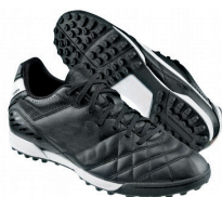
Crampons « stabilisés » Terrain synthétique