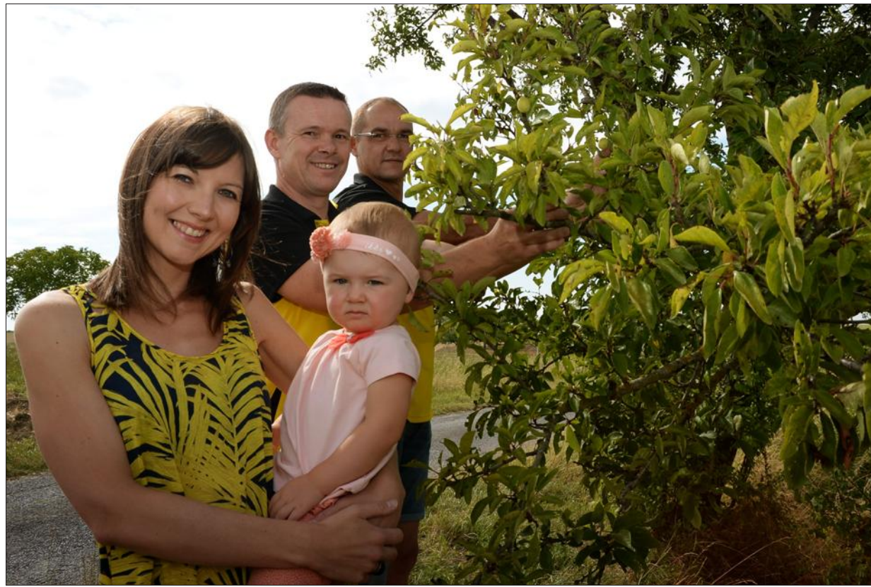
Les bénévoles de l'ASBH font le point sur la récolte de mirabelles de cette année. Ils en auront besoin pour préparer les dizaines de tartes qui seront dégustées ce dimanche.

Chaque année, et notamment depuis 2011 et le concert de Tonton David, les festivités prennent plus d'ampleur. « Pour éviter que le public se lasse, nous changeons chaque année 30 % du programme, poursuit Emmanuel Fichter. Nous veillons à ce que tout le monde y trouve son compte. » Aussi, le programme est riche et varié, et toujours sous chapiteau. À 12 h, les convives profite-