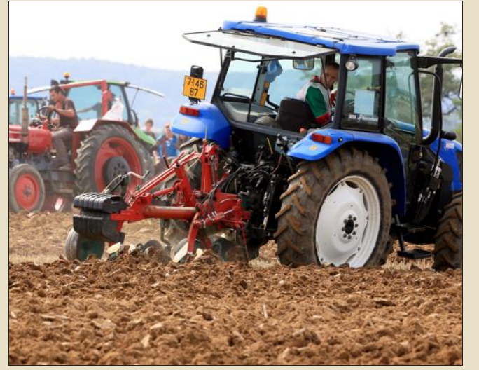
Que ce soit en planche ou à plat, l'essentiel le jour sera de labourer bien droit.

Malgré la conjoncture difficile, les laboureurs de Moselle-sud ne dérogeraient pour rien au monde au concours annuel. Le rendez-vous de l'été est prévu le dimanche 9 août dans une parcelle de la route de Brouviller à Lixheim. Selon la tradition, les candidats se mesureront dans les épreuves respectivement à plat ou en planche (avec charrue réversible ou pas). Les jeunes agriculteurs du pays de Sarrebourg, organisateurs de cette grande partie de campagne, prévoient également une course de labour en tracteur. Comme d'habitude, de nombreux stands, des attractions en lien avec la vie rurale, et des expositions de matériel, compléteront un tableau qui fleurit toujours bon le terroir. Et qui attire régulièrement tous les amis, acteurs et sympathisants du monde agricole. La compétition battra son plein au cours de l'après-midi. Elle sera sélective pour le championnat départemental, puis national. Les candidats sont priés de se faire connaître auprès du président des JA (jeunes agriculteurs) du secteur, Mathieu Grosse.