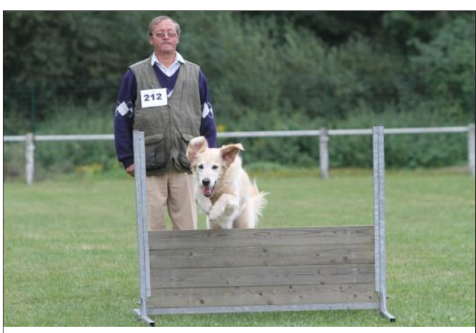
Chaque chien devra réaliser des exercices précis en compagnie de son maître.

Le Training club canin de la Sarre Rouge de Nitting organise les samedi 8 et dimanche 9 août un concours d'obéissance toute la journée au stade. Les chiens concurrents, conduits par leurs maîtres, devront réaliser des exercices précis tels que le saut de haie, le rappel, la marche au pied et bien d'autres