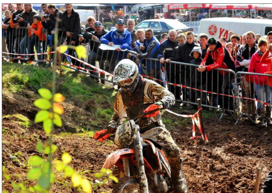
Plus de 200 compétiteurs viendront chercher la victoire ce week-end à Avricourt. Quatre épreuves d'enduro moto et quad sont au programme.

Le moto-club Bol d'Air organise ce week-end, la 7 e édition de l'Endurance du Renard, à Avricourt. Plus de 200 compétiteurs sont attendus.