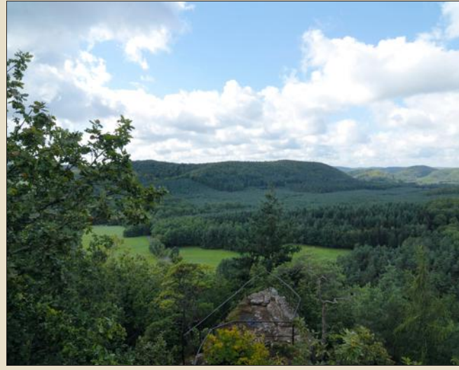
Le Parc naturel régional des Vosges du Nord fête ses 40 ans d'existence ce dimanche 9 août.

Le Parc naturel régional des Vosges du Nord fête ses 40 ans le dimanche 9 août à partir de 11 h à La Petite-Pierre. A 11 h et à 15 h concert gratuit d'Angela Avetisyan et son quartet à l'aire scénique de plein air (à côté du musée des Springerle) ; à 13 h : duo musical jongleur et échassier Les acrobates de Bouxwiller ; déambulation du centre vers la vieille ville « staedtel » (tour des terrasses et restaurants) ; à 14 h : duo musical bulles géantes Les Tricoteries & Cie à l'entrée de la vieille ville, puis déambulation ; à 14h50 et 15h30 : 1 er départ de la visite insolite du staedtel depuis l'école, par la Cie du Théâtre du marché aux grains ; à 17 h : concert de Marcel Loeffler & Lisa Doby place du château/Jerry Hans ; à 21 h : concert payant de Trio Rosenberg place du château/Jerry Hans ; à 22h45 : pour clore cette journée festive des 40 ans du Parc naturel, animation autour du feu. Une navette gratuite est mise en place à partir de 10h30 et relie le parking du stade (route de Petersbach) au staedtel. Restauration sur place.