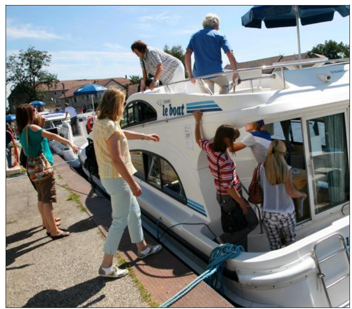
Voilà une bonne occasion de tirer quelques bords dans le port et aux abords.

La quatrième édition de la fête du canal à Hesse est annoncée pour ce dimanche 9 août à l'endroit habituel : le port de cette petite commune nichée dans son écrin de verdure et d'eau. Comme les années précédentes, elle débutera par une messe célébrée en plein air à 10 h 30 sur place. L'apéritif concert prévu à l'issue permettra aux convives de faire honneur aux nectars locaux tout en profitant du soleil, et surtout des flonflons. À l'heure du déjeuner, les chefs installés aux fourneaux concocteront des petits plats fleurant bon le terroir. Tout pour donner envie aux visiteurs de s'attarder au bord de l'eau, en attendant les balades à bord des