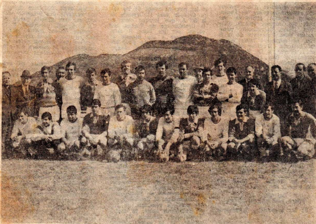
Témoin de l'amitié nouvelle qui unit désormais les joueurs du Pertre et de Lourdes, cette photo d'avant-match qui groupe pêle-mêle joueurs et dirigeants des deux clubs.