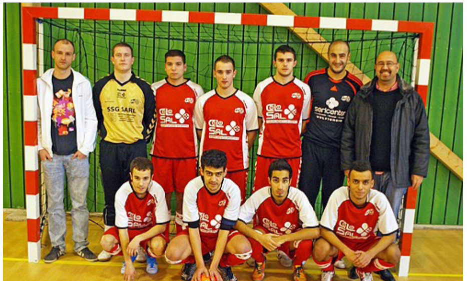
Entre jouer pour le plaisir et se lancer pleinement dans l'aventure « futsal », le cœur des Souffelweyersheimois balance.

Alors, les « Diables Rouges » gardent leur rêves dans un coin de leur tête, sans vraiment réfléchir à comment