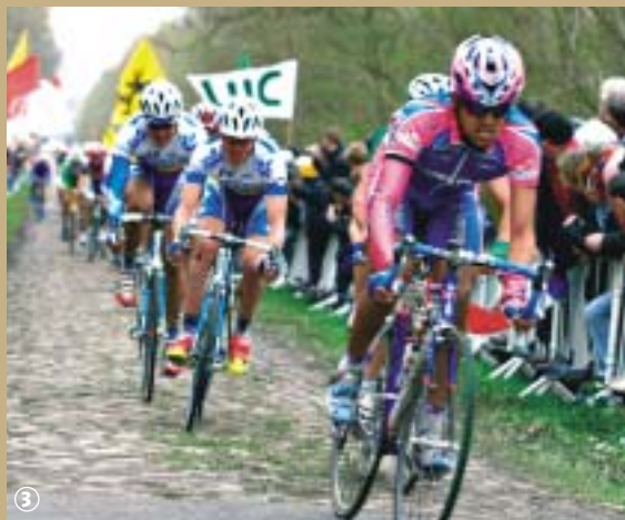
Course cycliste « Paris-Roubaix ».

Le carrefour de l'Arbre est le point stratégique, au même titre que la fameuse trouée d'Arenberg, de la