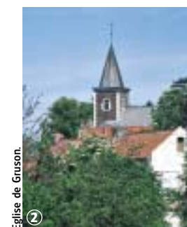
Eglise de Gruson.

Circuit à la découverte de la Petite Suisse du Nord à deux pas de la métropole. Les chemins pavés, les « voyettes », les sentiers agricoles traversent les champs, longent les fermes en rouge barre ou flirtent avec la Marque. La variante courte s'adresse particulièrement aux familles. Prudence le long de la rue d'Infière et le long de la RD 94 (point 6).