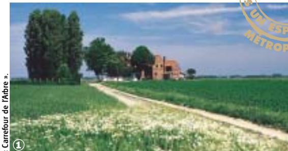
« Carrefour de l'Arbre ».

Sur les chemins de campagne de la Pévèle, du Mélantois et de la Haute-Deûle