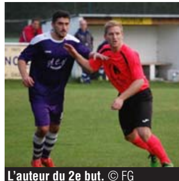
L'auteur du 2e but.

Pour ce match, Saint-Léger arborait une vareuse d'une drôle de couleur. Du genre saumon fluo. Ce sont les joueurs qui l'ont choisie. « Pour ma part ça m'arrange car je suis daltonien. Ainsi, je parviens mieux à distinguer nos couleurs et celles de l'adversaire! » FABRICE GEORGES