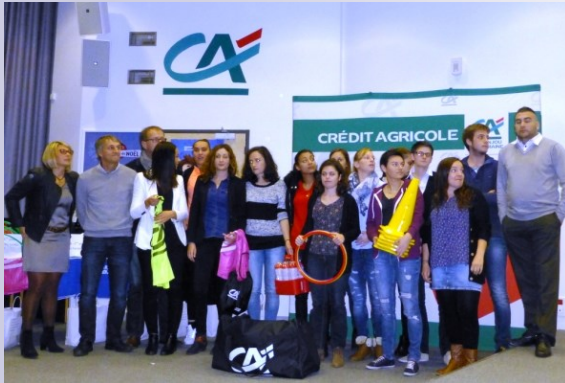
L'équipe Féminine d'Angers NDC ayant terminé première

Le 13 novembre dernier, a eu lieu au siège du Crédit Agricole de l'Anjou et du Maine, la remise des dotations du challenge Mozaïc. Quinze clubs ont été copieusement récompensés. Environ 150 personnes ont participé à cette manifestation et ont assisté à une démonstration de foot Freestyle. En outre, le Crédit Agricole a offert à chaque club 15 places pour le match SCO / LILLE du samedi 28 novembre 2016.